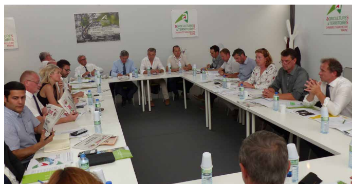
Echanges sur l'installation, l'alimentation, le glyphosate et les ZNT