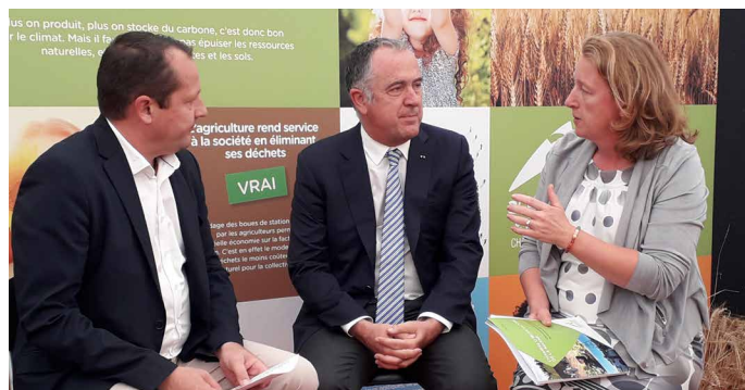
Une journée avec le Ministre de l'Agriculture

Le pôle d'information des Associations Foncières a été également régulièrement sollicité sur les questions de circulations agricoles.